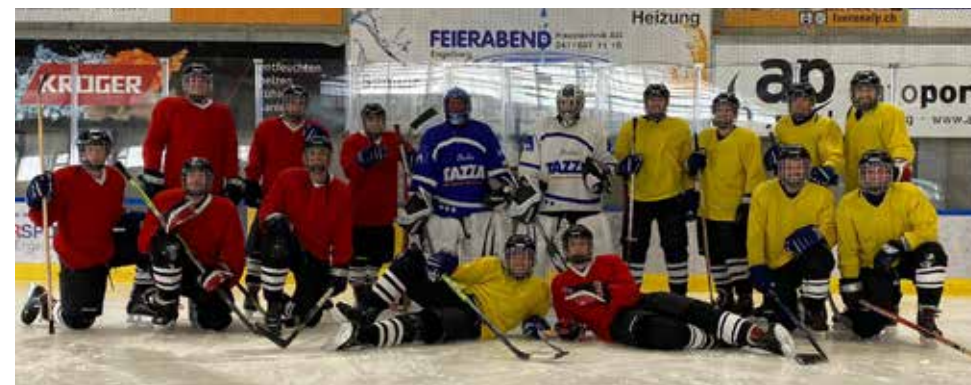
Der Teamspirit stimmt: Die 1. Mannschaft beim Eishockey-Plausch in Engelberg.